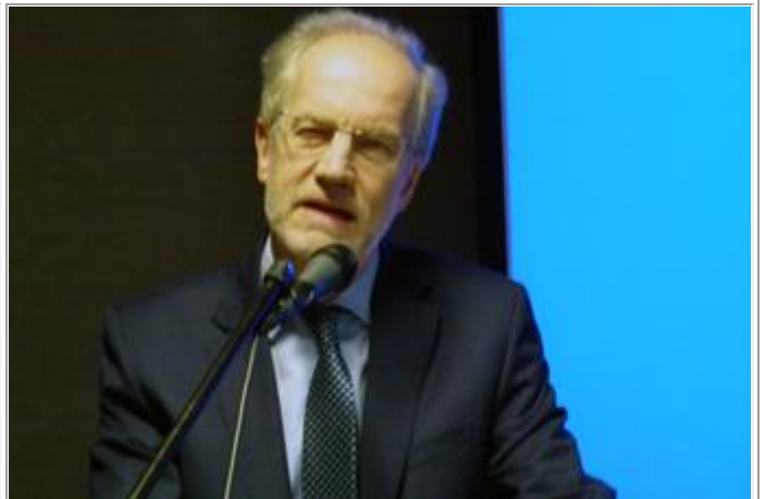
Toespraak van de nieuwe Vlaamse academicus 2015 over 'Verdwaald in al onze Talen'