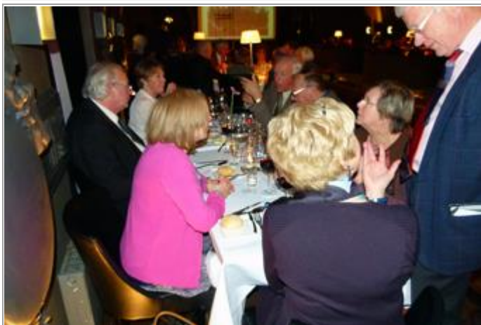
VVA-Limburgers aan tafel tijdens het vriendenmaal