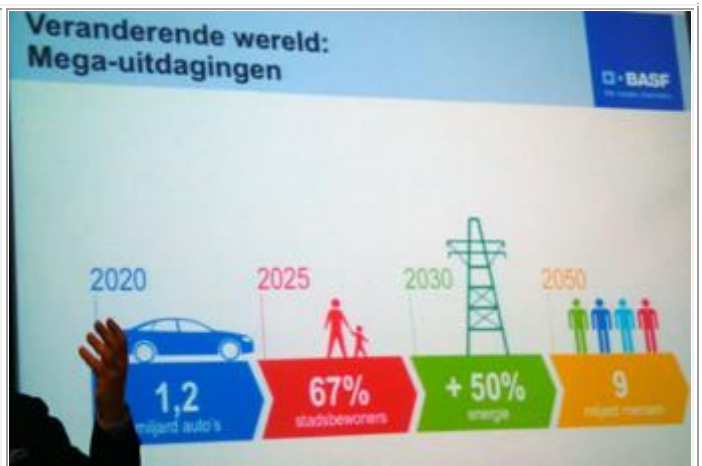
De Mega-uitdagingen 2020-2050 miljard auto's, stadsbewoners, energie, miljard mensen