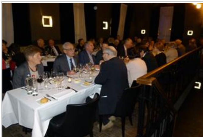
Nog veel volk aan tafel in La Riva