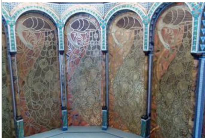
Vroege Art Nouveaustijl in de absis van het huis, in de vergaderruimte van de vrijmetselaarsloge, waartoe de reder behoorde