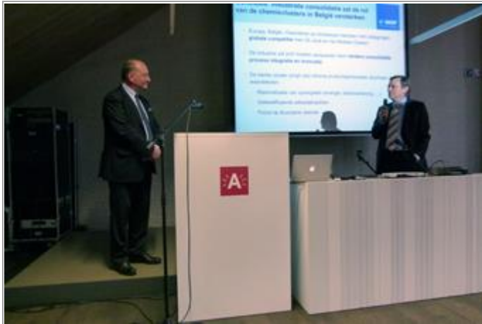
Conclusies en daaropvolgend dankwoord