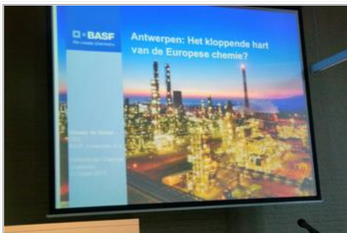
Antwerpen, het kloppende hart van de Europese chemie