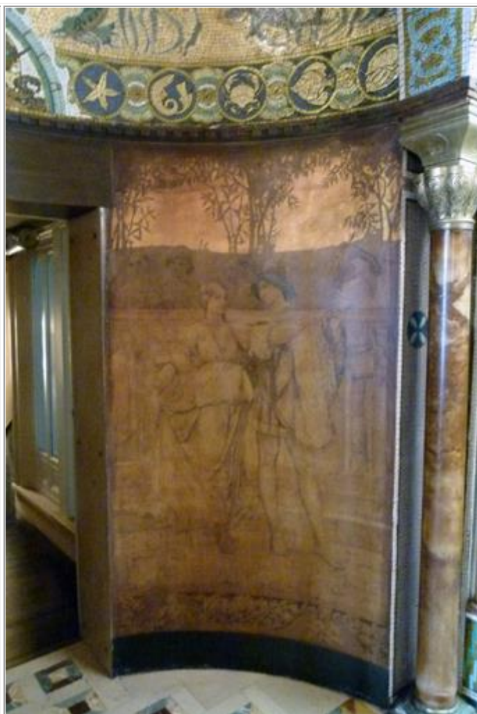
Het huwelijk in Art Nouveaustijl in de absis van het rederhuis op de 1ste verdieping van het museum