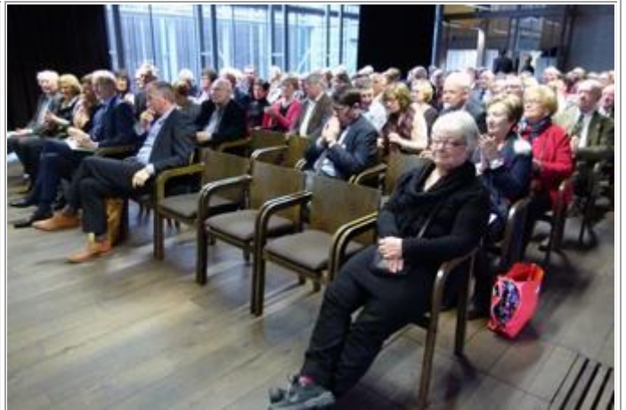
Het gehoor van de verenigde Vlaamse academici in de zaal