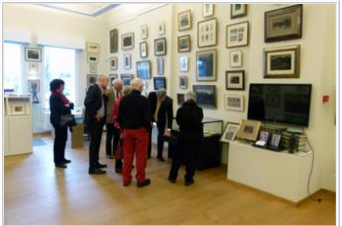
In de grote museumzaal op de benedenverdieping