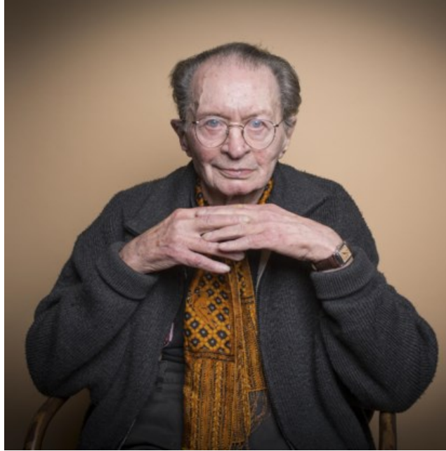
Remco Campert in 2016.

Het overlijden van Remco Campert betekent afscheid nemen van een weemoedige, opgewekte dichter, columnist en romanschrijver die het leven vierde door zo lichtvoetig mogelijk te schrijven.